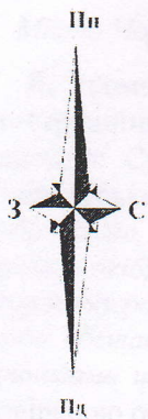
СХЕМА ПЛАНОВОЇ ОСНОВИ а визначення координат кутів повороту меж земельної ділянки