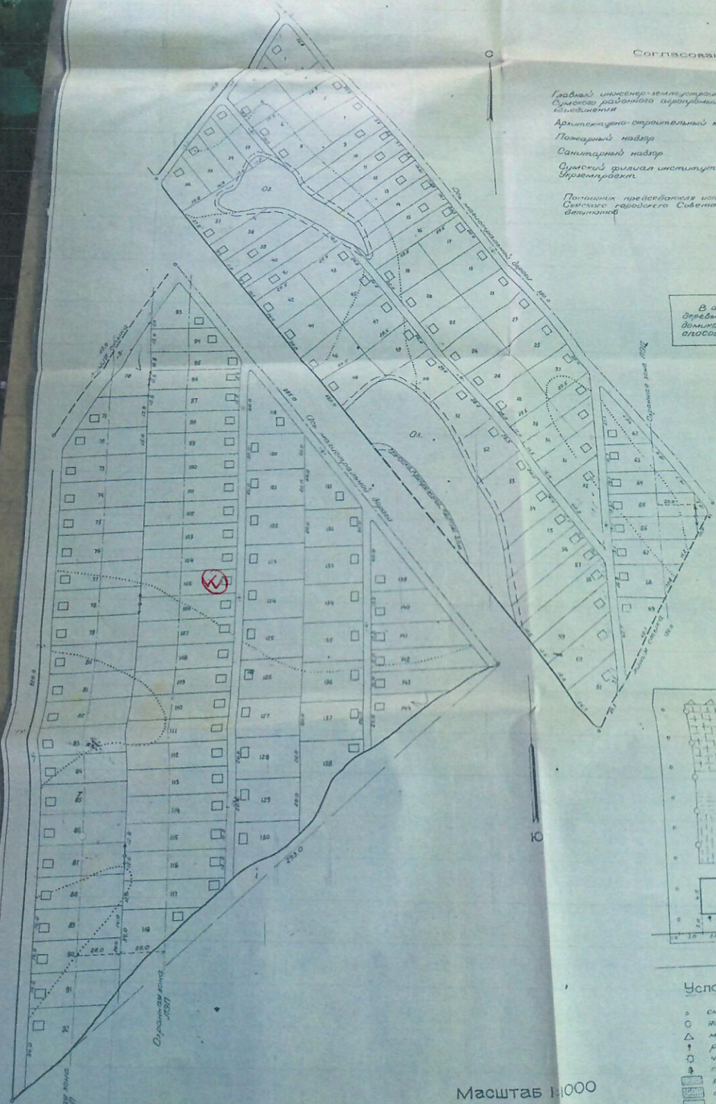
Схема организации территории участков в коллективном саду

В охраняемых зонах ЛЭП запрещается постройка дачных домов, гаражей, складов, а также полив металлизированным способом.