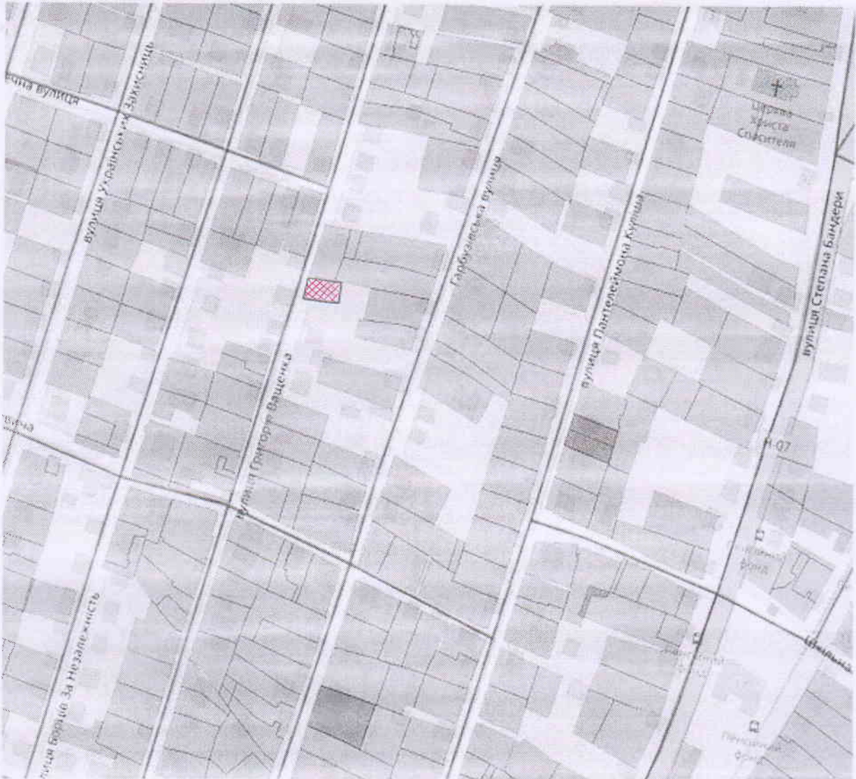
Схема розташування земельної ділянки для будівництва і обслуговування житлового будинку, господарських будівель і споруд (присадибна ділянка), за адресою: м. Суми, вул. Григорія Вашенка, буд. 15 Сумської області Кадастровий номер: 5910136600:20:007: 0019