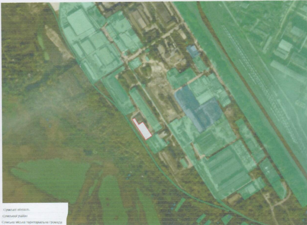
Сумська область Сумський район Сумська міська територіальна громада