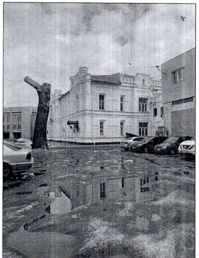
Двір будинків по вул. Соборна, 43 та Покровська площа, 8