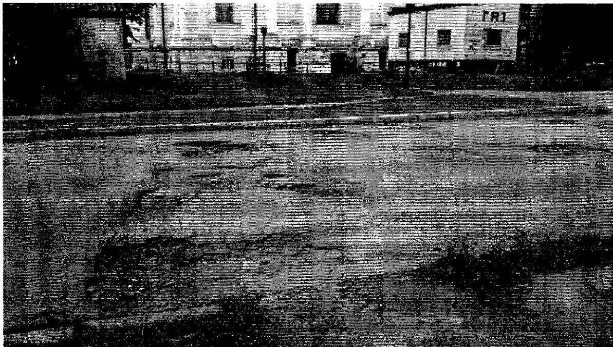
Фото: аварійна ділянка дороги, що не відповідає державному стандарту України на площі Троїцькій