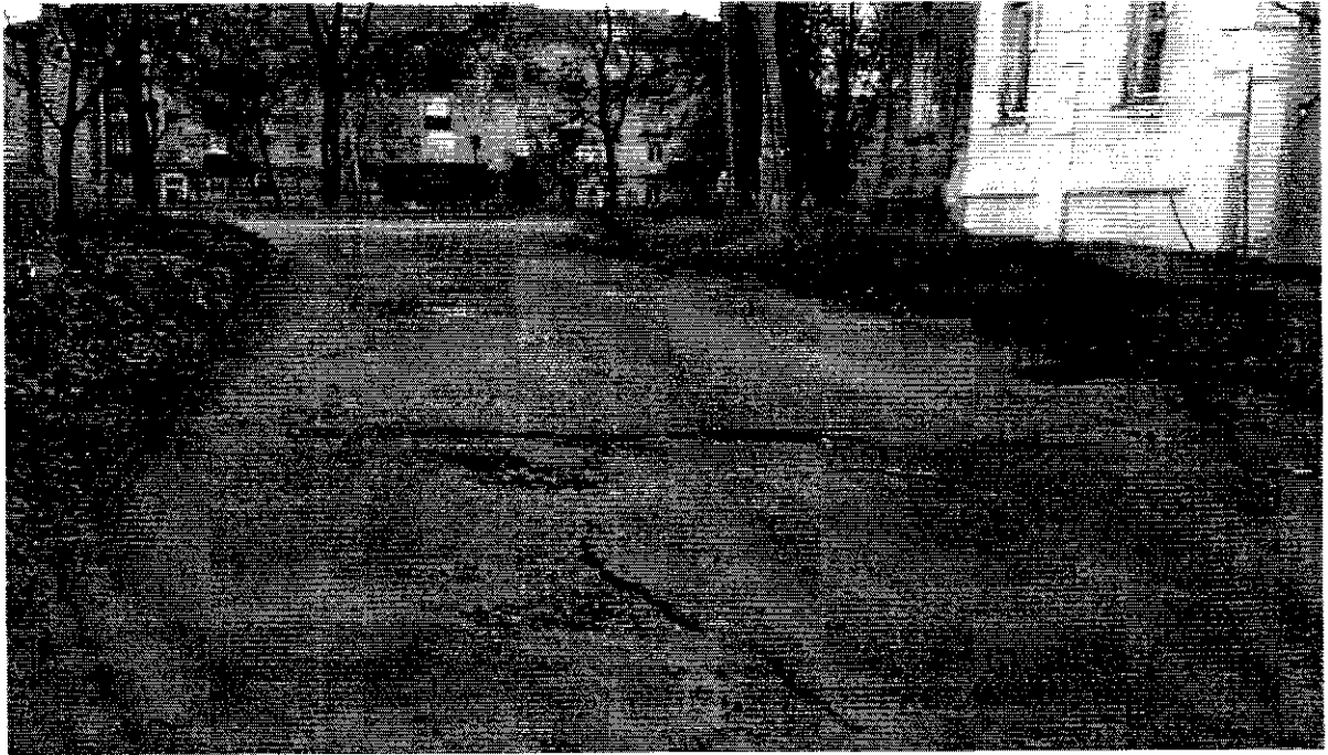
Фото: аварійна ділянка дороги, що не відповідає державному стандарту України на вул. Лучанській