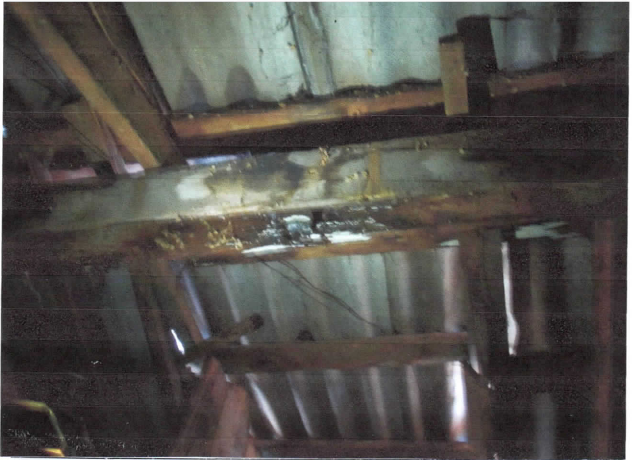
Замокання дерев'яних конструкцій коника. Як результат - гниття дерев'яних балок.