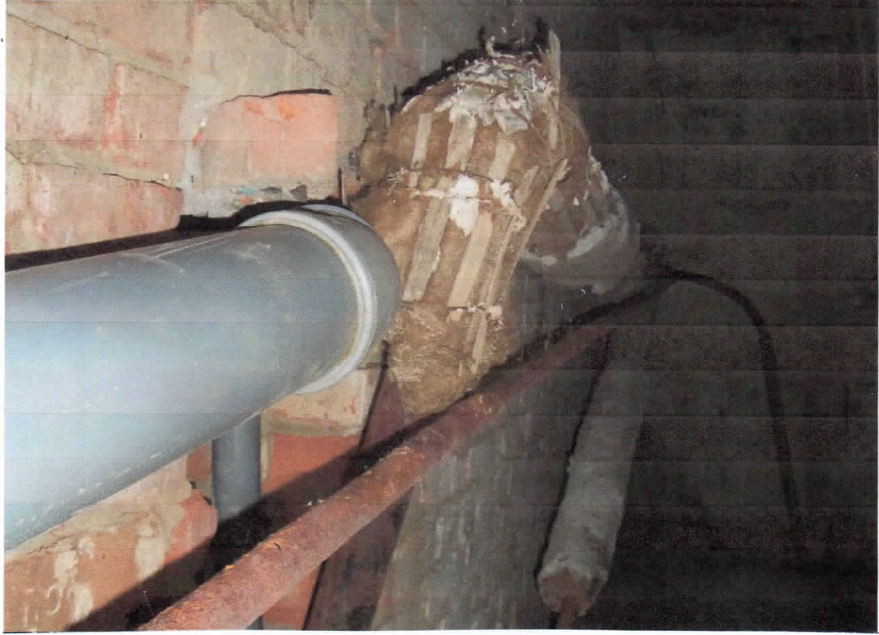
Іржаві труби системи опалення потребують заміни.